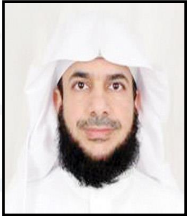
وكيل الجامعة أ.د. منصور بن عبدالرحمن حيدري