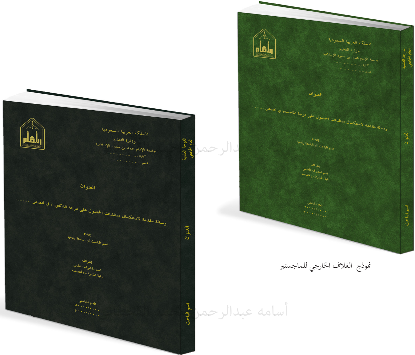
نموذج الغلاف الخارجي للماجستير