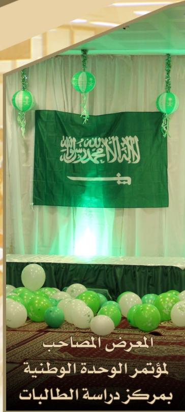
المعرض المصاحب لمؤتمر الوحدة الوطنية بمركز دراسة الطالبات