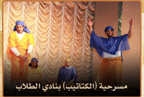
مسرحية (الكتاتيب) بنادي الطلاب