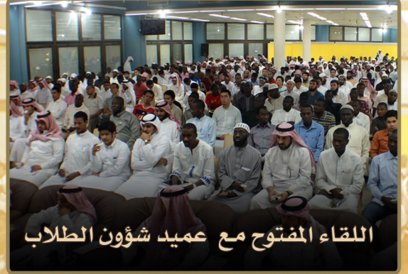
اللقاء المفتوح مع عميد شؤون الطلاب