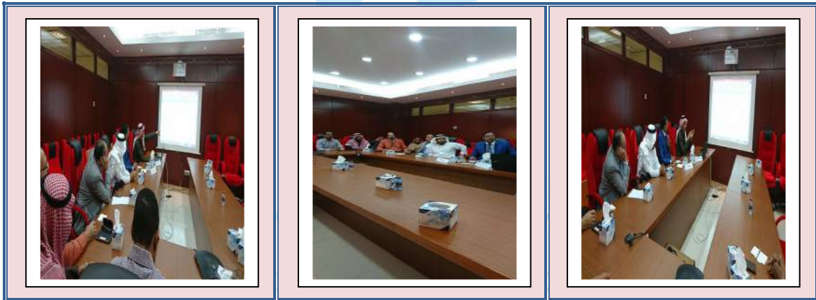
WORLD ARABIC LANGUAGE DAY