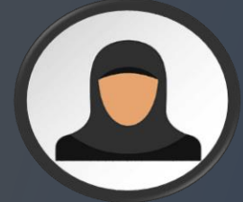
وكالة الكلية لشؤون الطالبات د. تهاني بنت خالد الجبير