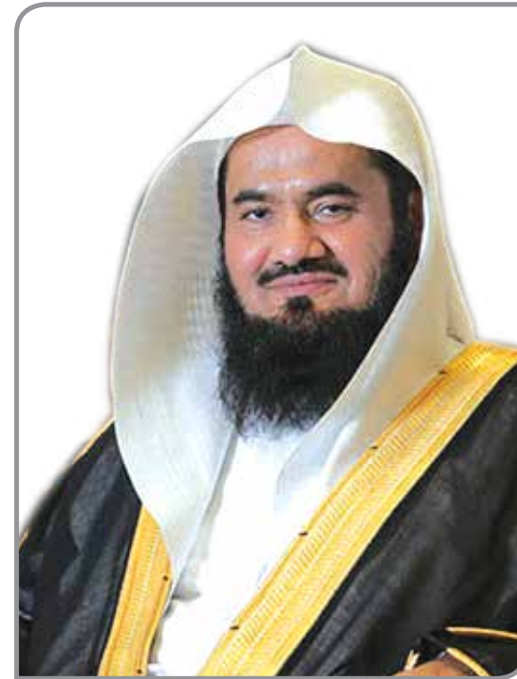
أ.د. إبراهيم بن محمد قاسم الميمن