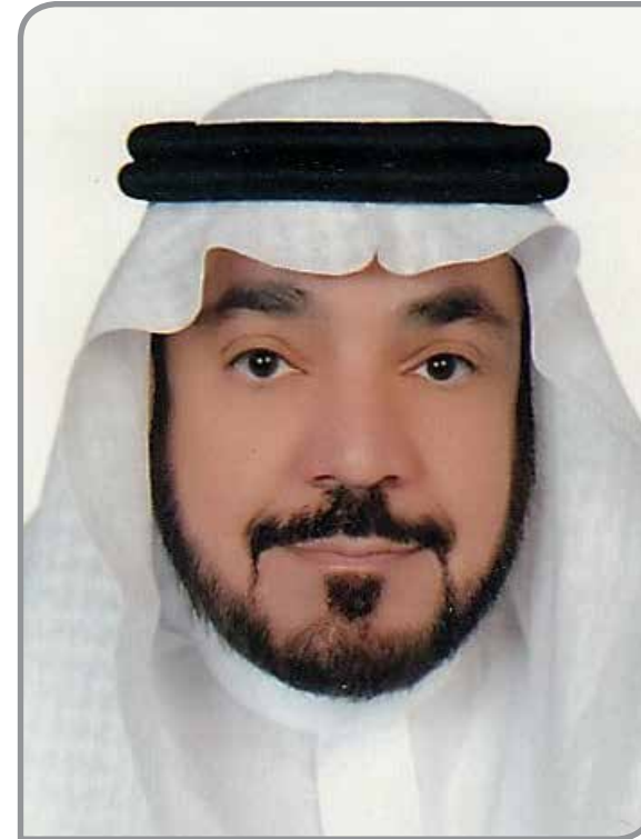
أ.د. فهد بن عبدالعزيز الدامغ كلية العلوم الاجتماعية