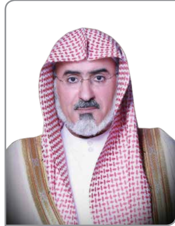
معالي الأستاذ الدكتور سليمان بن عبد الله أبا الخيل مدير الجامعة عضو هيئة كبار العلماء