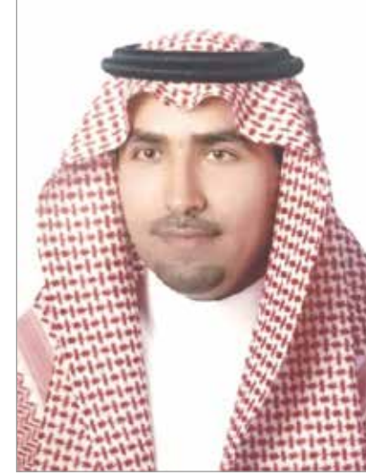
كلية وكيل الجامعة للدراستات العليا والبحث العلمي ورئيس هيئة جائزة التميز البحثي

وسعيًا من الجامعة في تكريم المتميزين من الباحثين، ومن أجل توفير البيئة المحفزة للباحثين للإسهام في النهضة العلمية التي تشهدها المملكة العربية السعودية فقد بادرت بإطلاق جائزة التميز البحثي التي نحتفل اليوم بالدورة الحادية عشرة لها. وتعد الجائزة أحد أهم محفزات أعضاء هيئة التدريس بالجامعة لإعداد الأبحاث المتميزة التي تجمع الأصالة والابتكار. وهي إحدى آليات تنفيذ الهدف الإستراتيجي الثالث (تطوير القدرات البحثية لأعضاء هيئة التدريس) من خطة البحث العلمي في الجامعة التي اعتمدها مجلس الجامعة عام ١٤٣٠هـ، كما تهدف الجائزة إلى نشر ثقافة التميز العلمي في الجامعة، وإلى الإسهام في رفع كفاية