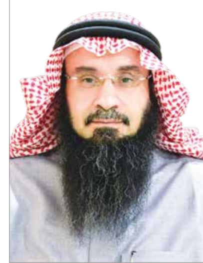
كلمة عميد البحث العلمي ونائب رئيس هيئة الجائزة

لقد أسهمت الجائزة من خلال إحدى عشرة دورة في اختيار مجموعة من الأبحاث المتخصصة، وإن هذا ليؤكد الدور المهم في التحفيز للعمل الإيجابي والطموح من أجل مستقبل زاهر، كما أنه يساعد في نشر ثقافة التنافس بين الباحثين في الجامعة، ويحفز لإنجاز الأبحاث المتميزة في مختلف التخصصات.