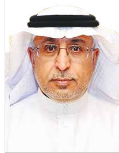
كلمة معالي رئيس جامعة الإمام محمد بن سعود الإسلامية

ومن هذا المنطلق حرصت جامعة الإمام محمد بن سعود الإسلامية على تشجيع علمائها من أعضاء هيئة التدريس نحو السعي إلى البحث العلمي المتميز، ونحو التنافس في نشره والإتقان في إعداده، ومشاركة العلماء الآخرين للاستفادة منه، وإن جائزة التميز البحثي تعد من أهم محفزات أعضاء هيئة التدريس بالجامعة، ومن أهم مظاهر تشجيع الأبحاث المتميزة التي تجمع بين الأصالة والابتكار، لتحقيق الهدف الاستراتيجي في تطوير القدرات البحثية لأعضاء هيئة التدريس، والإسهام في رفع كفاءة الأبحاث المنتجة، وتسخير الجهود البحثية لتلبية حاجات المجتمع .