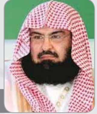
معالي الأستاذ الدكتور عبدالرحمن بن عبدالعزيز السديس