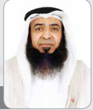
الشيخ عادل بن عبدالرحمن المعاودة

الهدف الرئيس للبحث: بيان علاقة السلوك الخاطئ للفرد والجماعة بقراءة النص الشرعي، وعلاج ذلك الانحراف. وناقشت في بحثي هذا الانحراف الذي تعاني منه الأمة اليوم، والذي كان سبباً في استباحة دماء وأعراض وأموات المسلمين. وراعيت في هذا البحث المنهج المعتمد في الدراسات الأكاديمية. وقد جاء البحث في مقدمة وتمهيد بينت فيه مفهوم إشكالية النص وأنواعه، وأثره في ظهور الفرق العقدية المنحرفة. وفي المبحث الأول : ناقشت إشكالية النص في الثبوت وأثرها في الانحراف العقدي وزعزعة الأمن. وفي المبحث الثاني: ناقشت إشكالية النص في الدلالة وأثر الجهل بعلوم الشريعة ومقاصدها في الانحراف العقدي. وفي المبحث الثالث: ناقشت حبس النص في الفهم وتحوله إلى نص يتحاكم إليه. وفي المبحث الرابع: كان العلاج والوقاية من إشكالية النص، وأثر ذلك في تحقيق الأمن. وخلصت في الخاتمة إلى نتائج، منها: الأمن الفكري أساس الاستقرار، وأمان المجتمع من الانحراف. وإن إشكالية النص تتبع لعقيدة القارئ، فتصحيح المفاهيم في الأذهان ينتج أمناً فكرياً. ثم أجملت بعض التوصيات: وهي التكتيف في مجال دراسة العقيدة في المؤسسات التعليمية، والعمل على المؤتمرات للتعريف بالعقيدة الصحيحة، مع متابعة الشباب المسلم، وتنشئته على العقيدة الصحيحة، إضافة إلى وجوب محاربة الانحراف بكل الوسائل المتاحة.