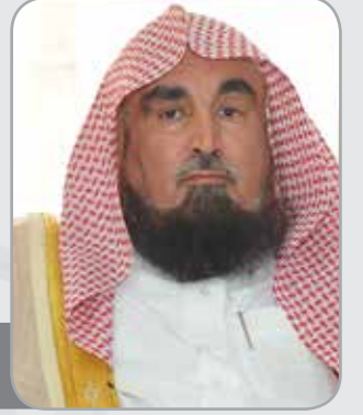
معالي الشيخ عبدالعزيز بن صالح بن عبدالعزيز الحميد