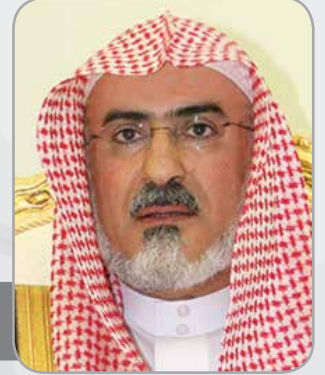
معالي الأستاذ الدكتور سليمان بن عبدالله أبو الخيل