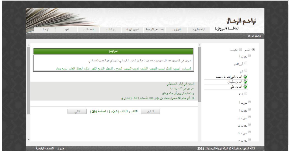
الشكل 1 صفحة تراجم الرواة

تم تقسيم هذه الصفحة الى 3 اقسام كما هو مبين في الشكل رقم (1) القسم الاول يحتوي على جميع اسماء الرواة والتي فصلت الى مجموعتين الاولى عن طريق الاسم الاول و الثانية عن طريق الكنية ، عند ضغط على اسم الراوي ، يظهر اسم الراوي بالكامل و الكتب التي ذكر فيها اسمه في القسم الثاني ، عند الضغط على اسم الكتاب ، يتم عرض الكتاب من الصفحة التي روى فيها اسم الراوي .