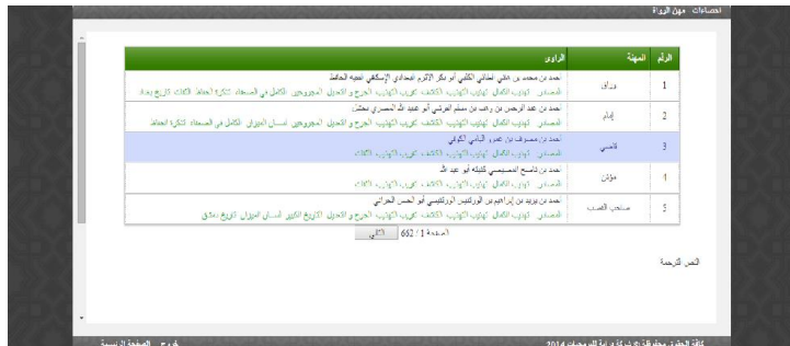
الشكل 14 مهن الرواة

إحصائية كل ما ذكر من مهن الرواة في جدول يحتوي على مهنة و اسم الراوي مع ذكر مصادره ، عند الضغط على اسم الكتاب ، يتم عرض الكتاب من الصفحة التي روى فيها اسم الراوي كما هو مبين في الشكل (14).