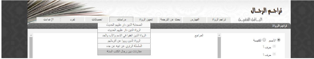
الشكل 5 قائمة الدراسات