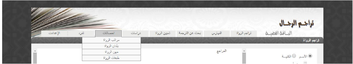
الشكل 12 قائمة إحصائيات