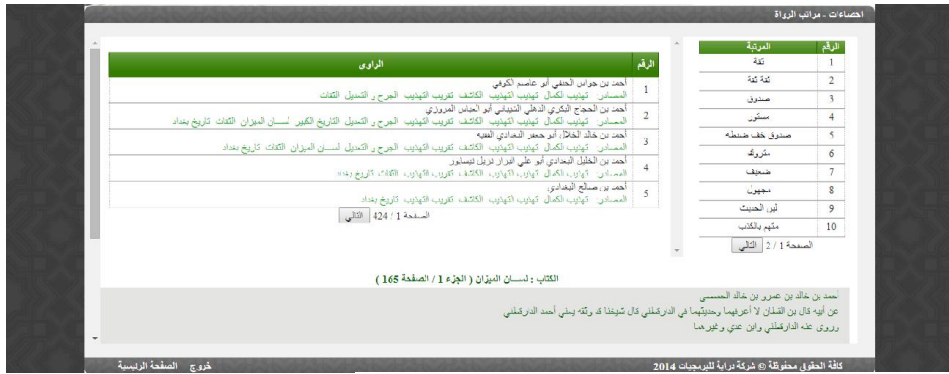
الشكل 13 صفحة مراتب الرواة

إحصائية حسب مراتب الرواة حسب سلم ابن حجر في تقريب التهذيب ، حيث يحتوي الجدول في الجزء الايمن من الصفحة على مراتب الرواة ، و عند ضغط على مرتبة ، يتم عرض جميع الرواة في الجزء الايسر من الصفحة مع مصادرهم ، عند الضغط على اسم الكتاب ، يتم عرض الكتاب من الصفحة التي روى فيها اسم الراوي كما هو مبين في الشكل (13).