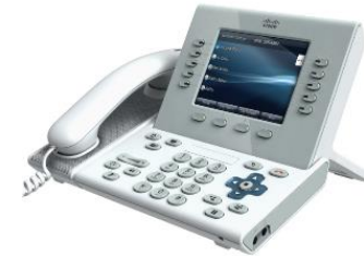
هاتف Cisco Unified IP 8961 و 9951