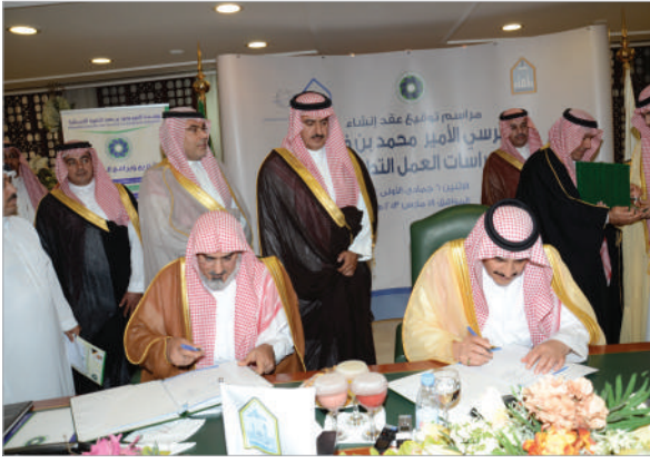
الشبابية للاحتفال باليوم الوطني.

وشارك الكرسي في ملتقى (التنمية في منظومة المجتمع المدني) بالتعاون مع جمعية التنمية الإنسانية، وقدم أستاذ الكرسي د. إبراهيم بن محمد الزبن ورقة علمية بعنوان «دور المنظمات الغير ربحية بالمجتمع السعودي في تمكين الشباب من المشاركة التنموية».